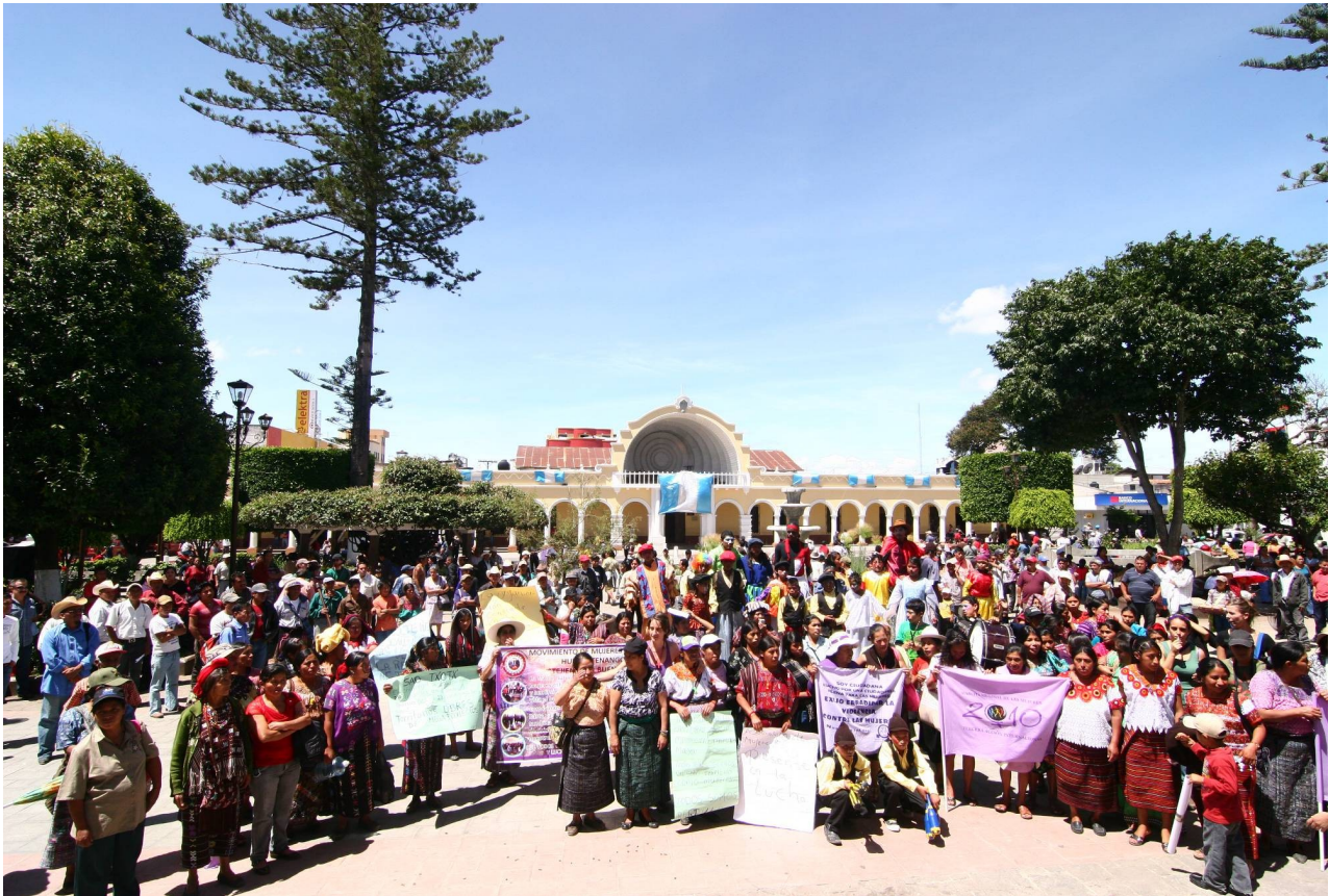
Lugar de encuentro del festival "Todas somos Barrillas" en la Plaza Central en Huehuetenango

Yalambojoch, Huehuetenango, una comunidad en la que habitan personas retornadas desde México como consecuencia del exilio forzado por la dictadura militar. El Festival reunió cerca de 200 mujeres mayas chuj, kanjobales, kakchiqueles, mam, ixiles, quichés, mestizas, latinoamericanas y europeas. El eje del festival fue la visibilización del vínculo que existe entre los proyectos económicos neoliberales, la ocupación militar de los territorios, el despojo de las tierras y las violencias sobre los cuerpos y la vida de las personas, particularmente de las mujeres.