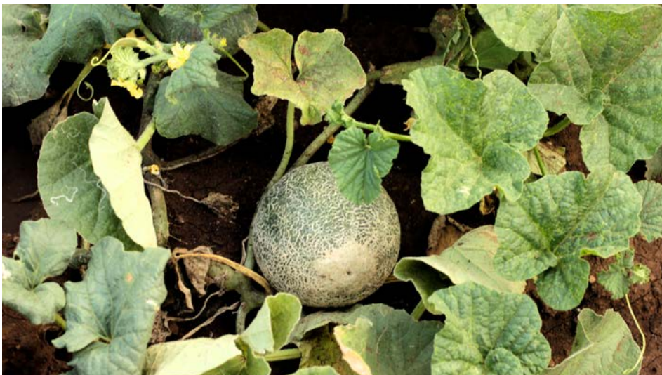
En los huertos familiares en la Costa Sur se dan melones. Champerico, 3.05.2023