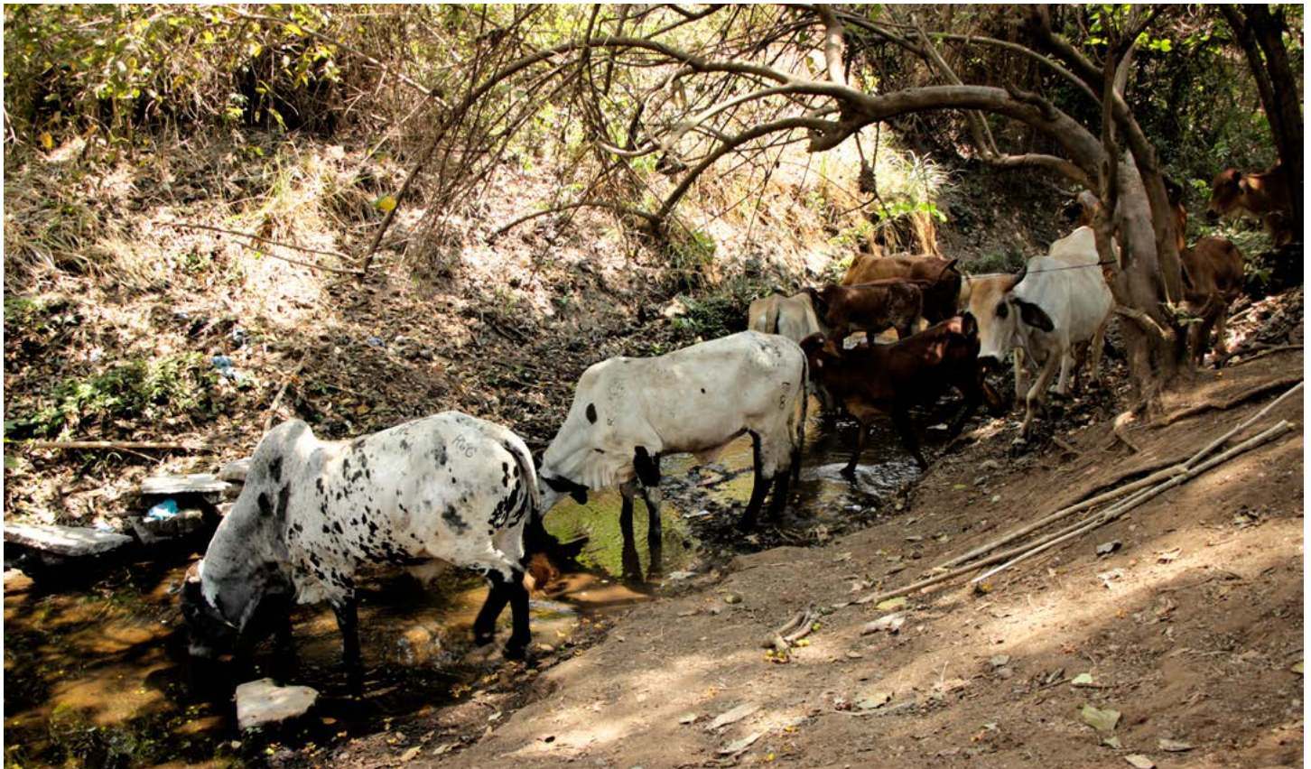
Mientras los ríos que usan habitantes de las comunidades para bañarse, buscar agua y alimentar a sus animales, bajan cada año más su cauce. Champerico, 14.03.2022.

A nosotros nos duele que se vayan, que dejen la comunidad, pues queda un vacío. Y cuando solo se va el papá, o la mamá y el papá, los niños quedan abandonados. La falta de oportunidades, el empobrecimiento y la desintegración familiar también hace que aumente la delincuencia, que se desarrollen maras. Porque si el niño no está al cuidado de papá y mamá, si se quedan al cuidado de un tío o una tía, no se le puede dar la misma atención, entonces salen a la calle y se pueden involucrar en drogadicción y vandalismo. Eso acaba afectando a toda la comunidad.