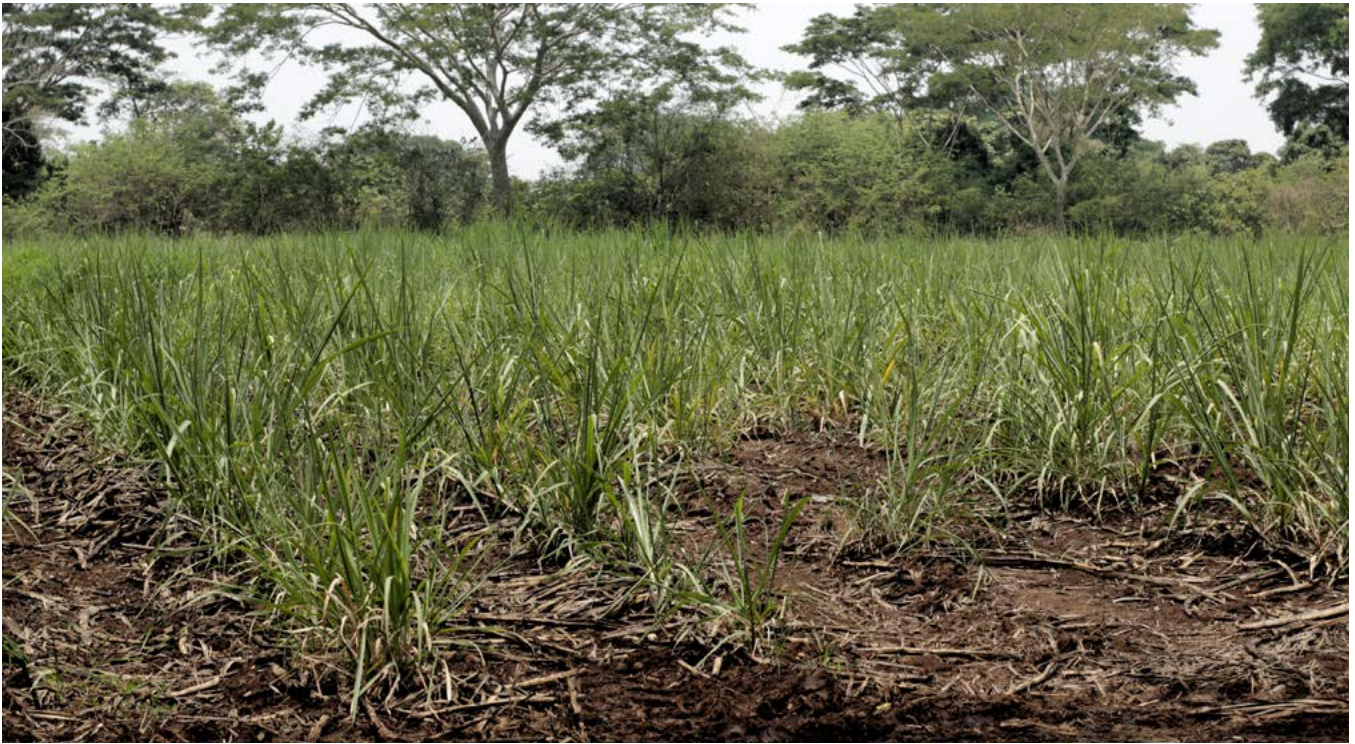
Campo de caña de azúcar en Champerico. 3.05.2023.