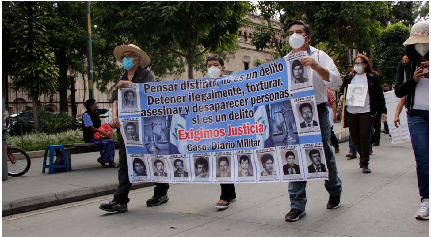
Integrantes de FAMDEGUA en la marcha por la Dignificación de las Víctimas del Conflicto Armado Interno, 25.02.2022