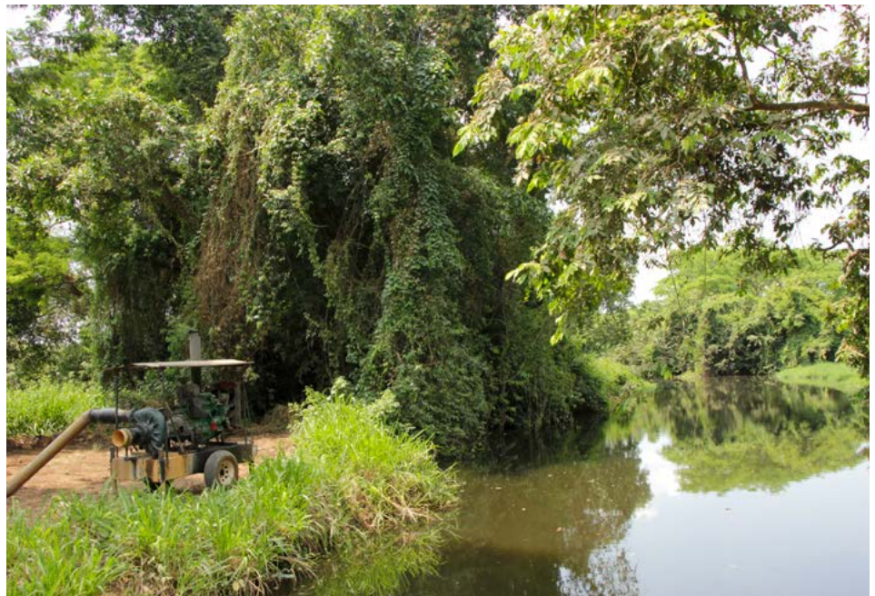
Bombas extraen el agua para introducirla en tuberías que la llevan a los campos de caña. Champerico, 3.05.2023.

A: En este caso han logrado llegar 25 personas a los Estados Unidos. Otras 25, más o menos, están trabajando en México, porque la Migra los regresó a ese país y ahí se han quedado. Y los otros no han podido llegar a su destino, han regresado y su lucha sigue. Algunos ahora están en El Salvador, vendiendo manía o dulces. Otros migraron a Belice porque allí hay empleo, hay corte de naranja. Otros están fuera del departamento de Retahuleu vendiendo