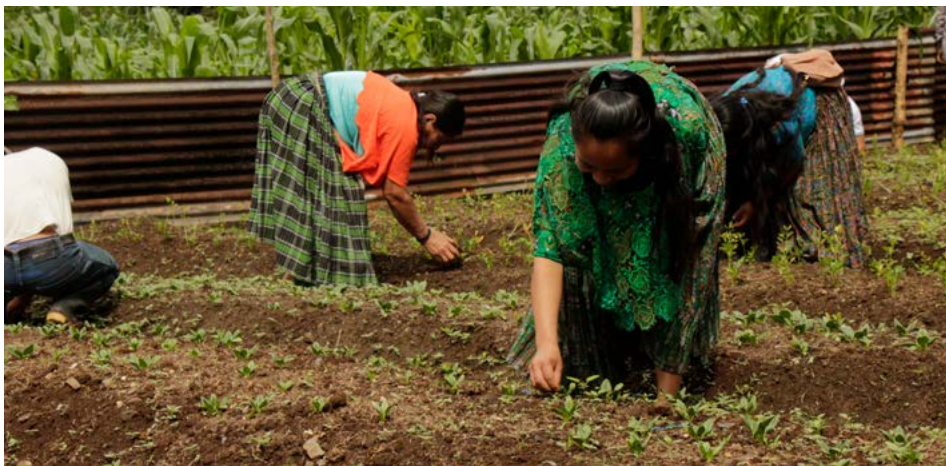
Campesinas y campesinos de la comunidad Villa de Guadalupe, integrante de la UVOC, establecieron un huerto comunitario donde siembran apio, cilantro, acelga y espinaca. Además producen su propio abono orgánico. Senahú, 20.01.2024

Para hacer frente a esta situación la REDSAG propone la defensa de la soberanía alimentaria 14 , que “es el derecho de los pueblos a producir sus propios alimentos según sus propias formas. Tiene que ver con la larga tradición de producción de alimentos de los pueblos indígenas. Defiende el agua, la tierra, el territorio, las semillas y los conocimientos ancestrales. La