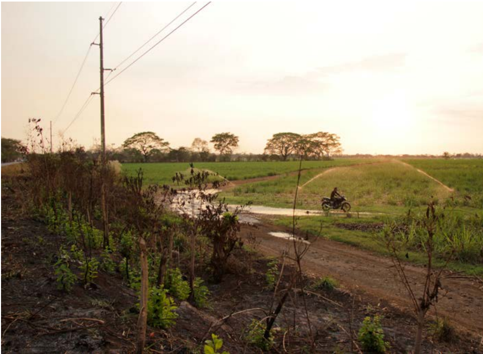
La riega en los campos de caña se mantiene muchas veces por las 24 horas. Champerico, 28.03.2022.

pero con pensamientos de personas grandes. Acá no existe el Estado, no está presente, y eso provoca grandes flujos de migración. Sabemos que hay un Estado, pero nunca está aquí con nosotros, brindando oportunidades.