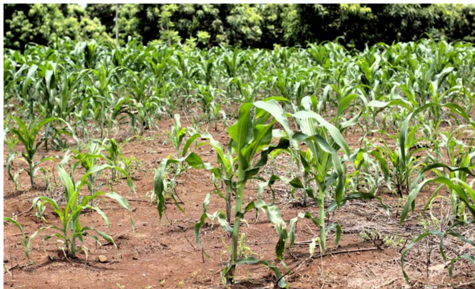
La milpa en la Costa Sur no se ha desarrollado como lo esperado por la falta de lluvia. Champerico, 15.06.2023

Parte del trabajo que realizamos desde PBI incluye visitas a las comunidades que acompañamos. Una de las luchas que llevan a cabo estas comunidades es defender su derecho a la alimentación. Lamentablemente hemos podido comprobar in situ, la cada vez más precaria situación en que se encuentran muchas familias campesinas e indígenas.