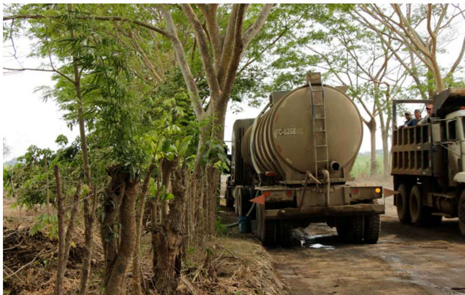
Los camiones con depósitos de agua se llenan en los ríos para utilizar el agua en el riego de los campos de caña. Champerico, 29.03.2022.