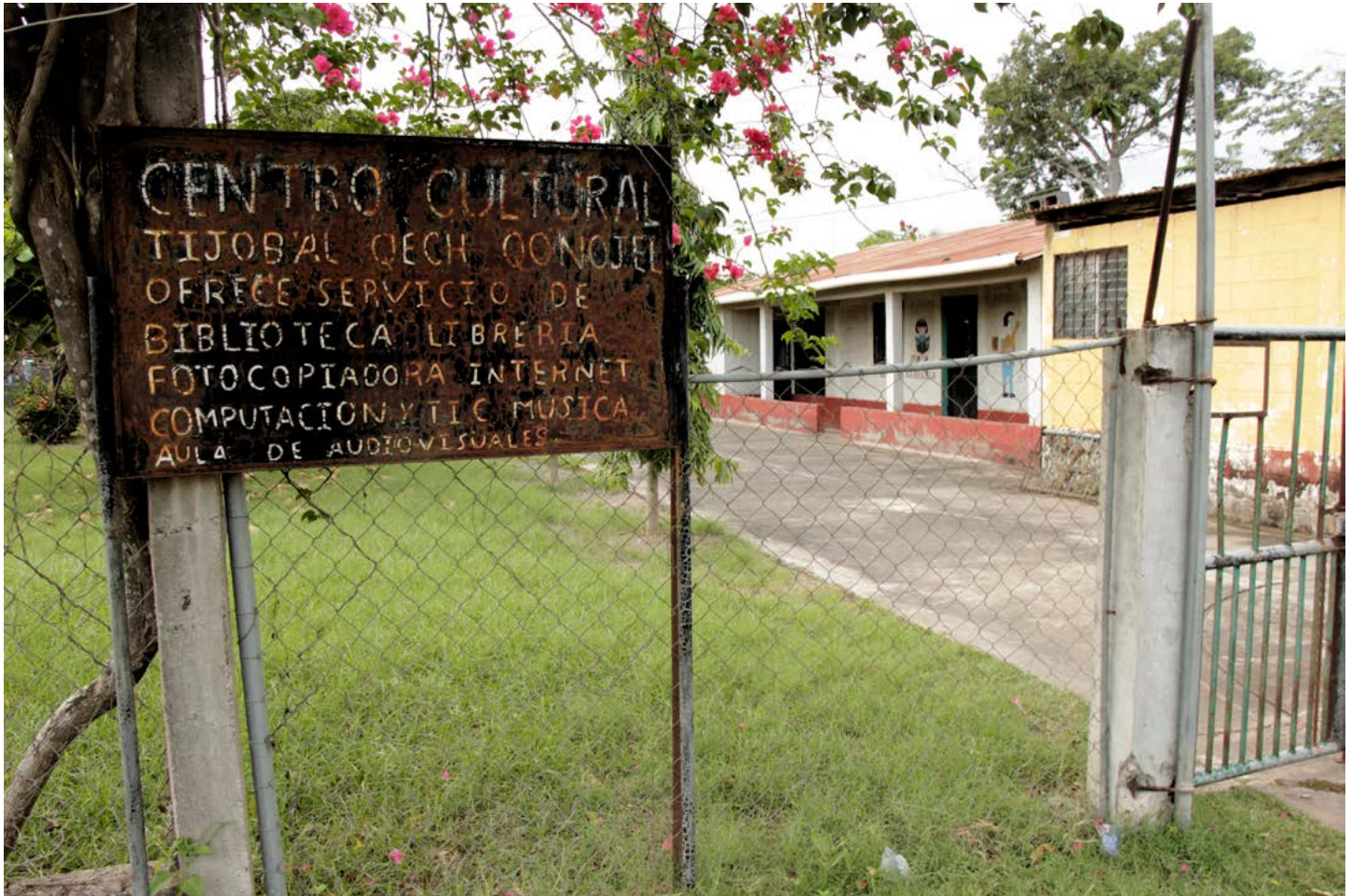
Al lado de la escuela se encuentra un Centro Cultural que ofrece una biblioteca y un centro de computación