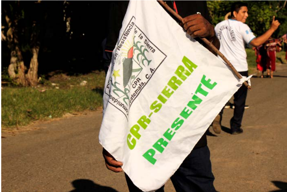
La bandera de la CPR-Sierra al inicio de la caminata conmemorativa en El Triunfo en el aniversario el 23 de septiembre de 2023.

CPR-Sierra a 25 años de su llegada a El Triunfo