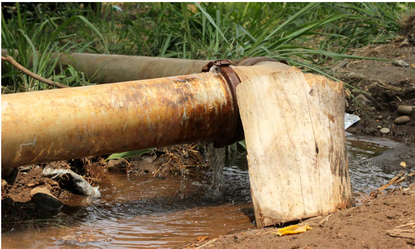
Fuga de agua en la tubería de las empresas cañeras, mientras las comunidades vecinas no tienen agua, Champerico, 3.05.2023.

Los ingenios a nosotros nos vienen a joder, porque tenemos terreno pero no agua para producir. Es un modelo que el Estado de Guatemala nos está imponiendo. Nadie nos ha consultado si queremos ese tipo de proyectos en nuestras comunidades. Si el Estado estuviera presente aquí, garantizando oportunidades, se podría frenar la migración.