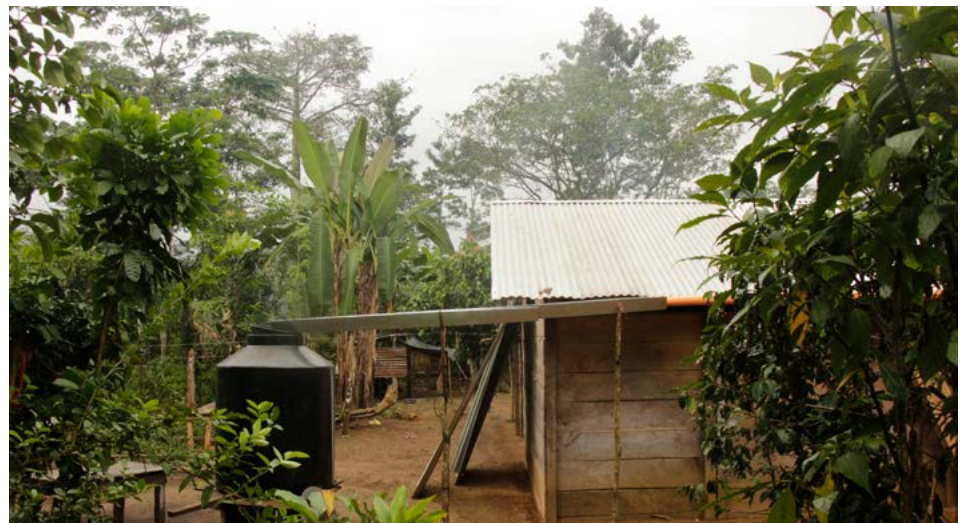
Los tinacos colectan el agua de lluvia para el uso en la cocina, para bañarse y regar las plantas de los huertos. Sapalau Samutz, 17.01.2024

pequeña escala que, según la FAO [Organización de las Naciones Unidas para la Alimentación y la Agricultura], brinda el 70% de los alimentos que se consumen en el mundo. Guatemala votó en contra de la declaración de los derechos campesinos 17 , lo cual es totalmente ilógico si pensamos que el mayor sector productivo en Guatemala son los pequeños productores, mientras que los monocultivos no alimentan a la población. El MAGA ha pasado fondos del presupuesto del Programa de Agricultura Familiar para el Fortalecimiento de la Economía Campesina a un programa asistencialista de entrega de alimentos, lo que significa que, en lugar de apoyar financieramente la producción de alimentos de calidad, el Estado utiliza los fondos públicos para regalar alimentos de baja calidad, como aceite de palma y alimentos industriales procesados que no necesariamente son nutritivos, pero quitan el hambre. Eso hace la política de seguridad alimentaria del gobierno de Guatemala: quitar el hambre a la gente sin importar