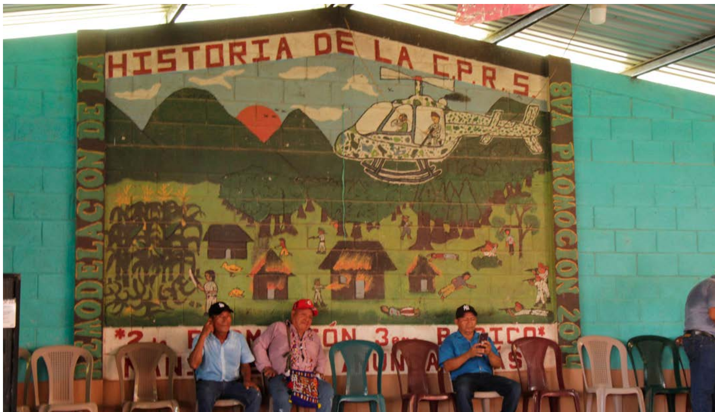
El mural en el salón comunal de El Triunfo, 23.09.2023

en el país, en sus componentes humano, cultural, material, psicológico, económico, político y social, que ocasionó violaciones a los derechos humanos y grandes sufrimientos para las comunidades que se vieron forzadas a abandonar sus hogares y formas de vida.” Por esta razón, el Gobierno de la República se comprometió “a asegurar las condiciones que permitan y garanticen el retorno voluntario de las personas desarraigadas a sus lugares de origen o al sitio que ellas elijan, en condiciones de dignidad y seguridad”. En diciembre 1996 se firmó el Acuerdo de Paz Firme y Duradera que terminó con el conflicto y permitió la entrada en vigor de los acuerdos negociados anteriormente.