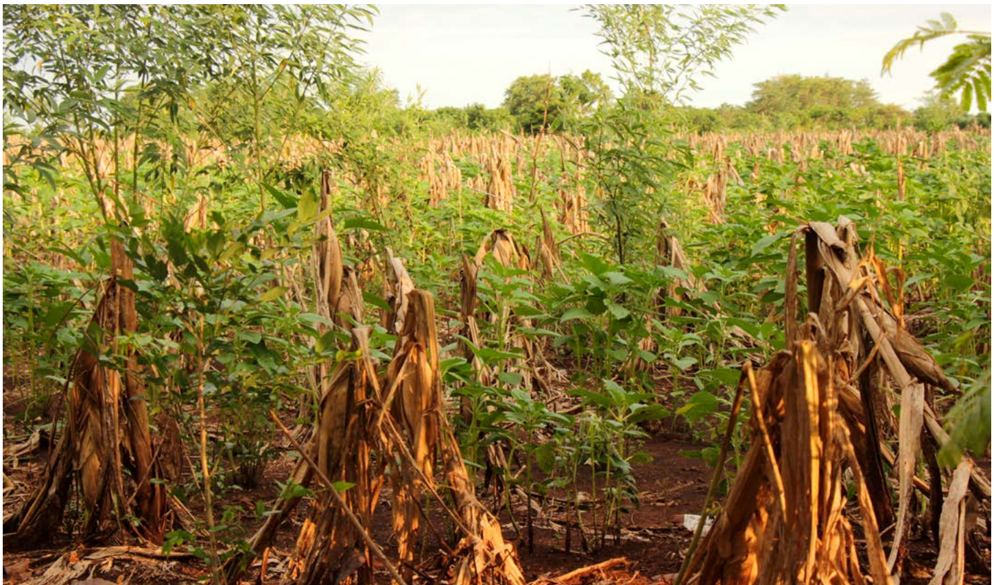
En los campos de maíz de la comunidad crece el ajonjolí entre las matas quebradas, 22.09.2023