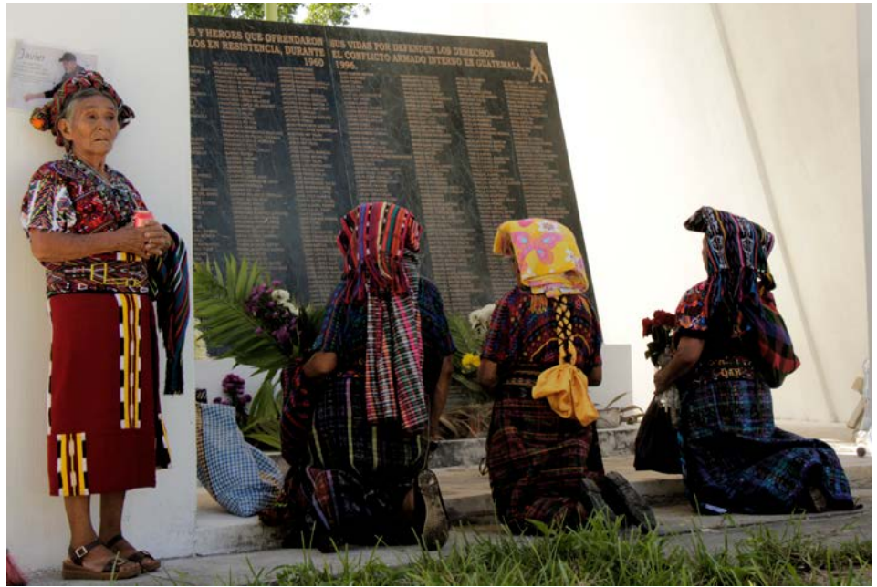
Vecinas ixiles y k'iche's en frente del Monumento a los Mártires y Héroes que ofrendaron sus vidas para defender los derechos de los pueblos en resistencia durante el conflicto armado interno 1960 a 1996 al concluir la caminata conmemorativa, 23.09.2023.