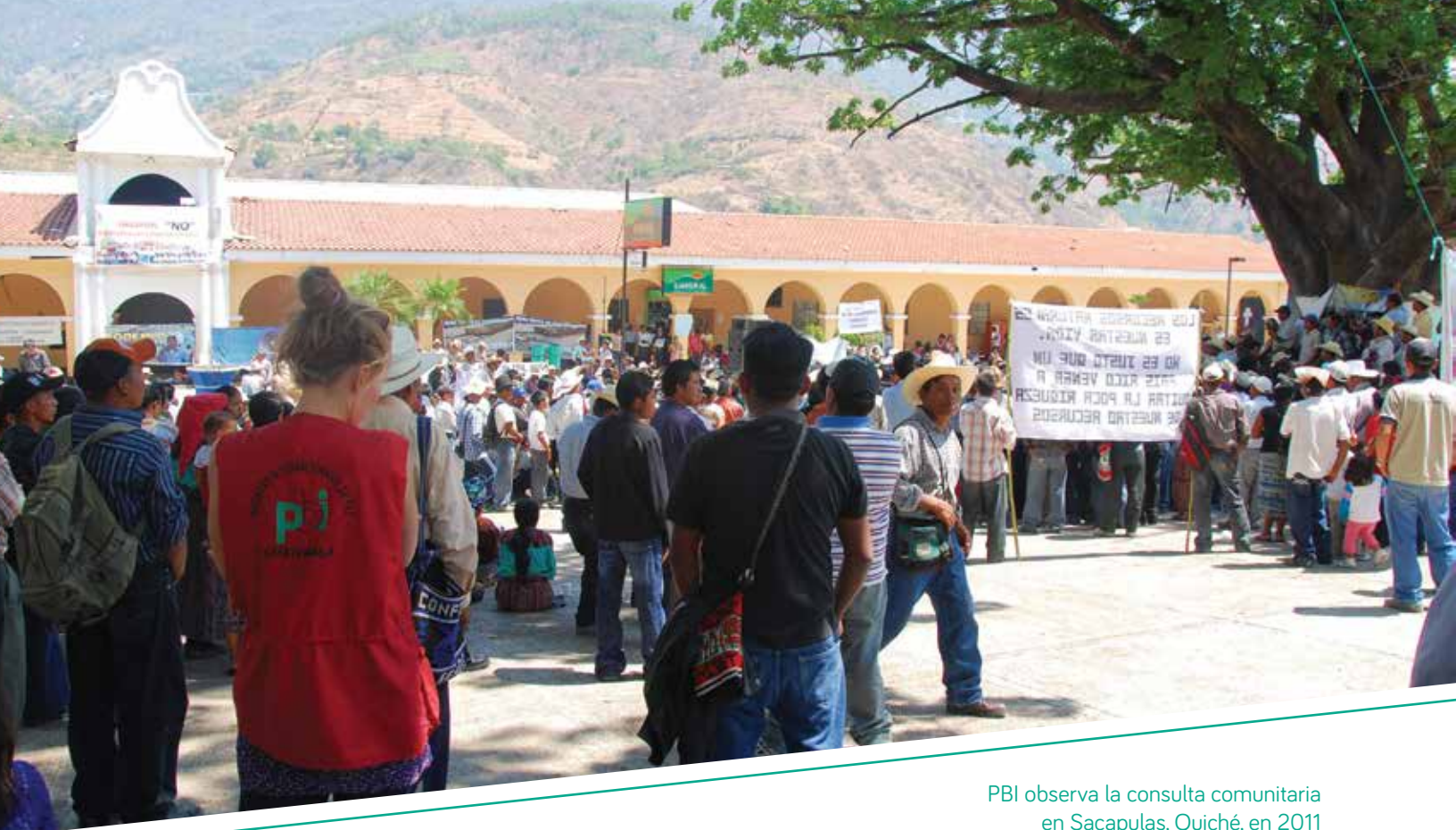
PBI observa la consulta comunitaria en Sacapulas, Quiché, en 2011

Del incumplimiento de los Acuerdos de Paz arriba mencionados, derivaron dos nuevos enfoques temáticos de acompañamiento. Por un lado el de la lucha por el acceso a la tierra y a los derechos laborales por los trabajos prestados, durante siglos, en tierras de las que se apropiaron poderosos terratenientes durante la corona española y tras la reforma liberal de 1871. Estas tierras incluían la mano de obra semiesclava de los denominados “mozos colonos”, que a cambio de vivir en estas tierras trabajaban para el “patrón” sin ningún tipo de derechos ni reconocimiento. En consecuencia, PBI recibió peticiones de acompañamiento por parte de organizaciones campesinas, algunas de las cuales seguimos acompañando hoy día, pues la problemática de tenencia de la tierra sigue sin solucionarse. Por otra parte, la apertura de la economía guatemalteca a las industrias extractivas trajo nuevos desafíos. Estas actividades afectaron especialmente a la población indígena, que se ha visto obligada a defender sus territorios frente a los enormes poderes económicos y políticos que impulsan dichas actividades, pues los impactos de estos proyectos extractivos tiene consecuencias desastrosas para todo el entorno de las comunidades afectadas: bosques, ríos, nacimientos de agua, montañas, lugares sagrados, medio ambiente, salud de la población, tejido social de