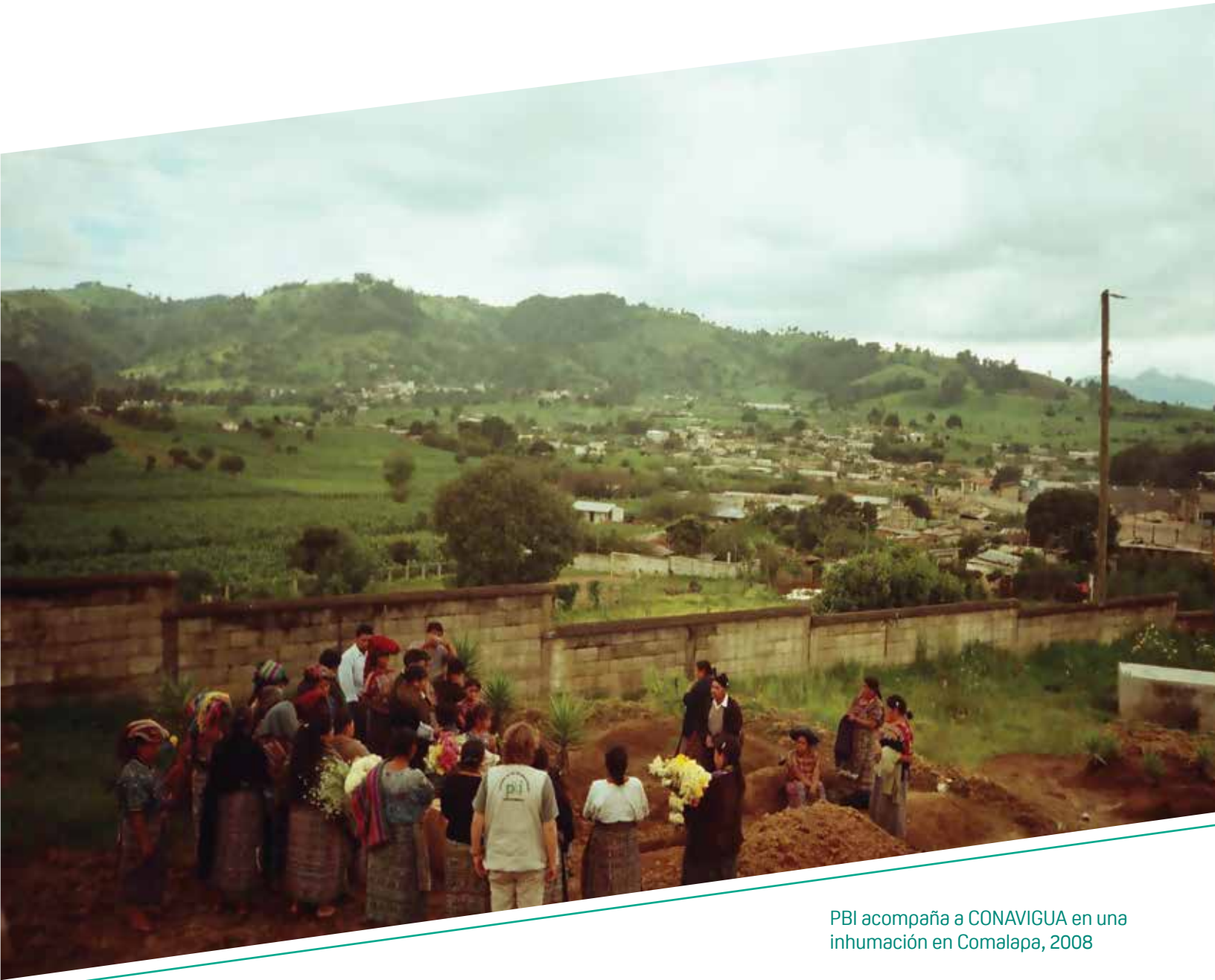
PBI acompaña a CONAVIGUA en una inhumación en Comalapa, 2008