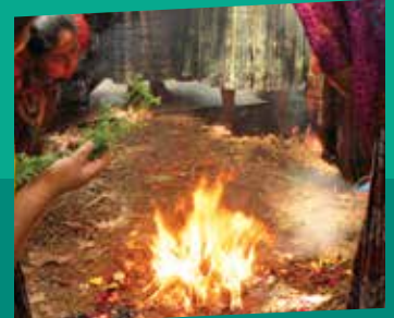
Fortalecimiento de capacidades