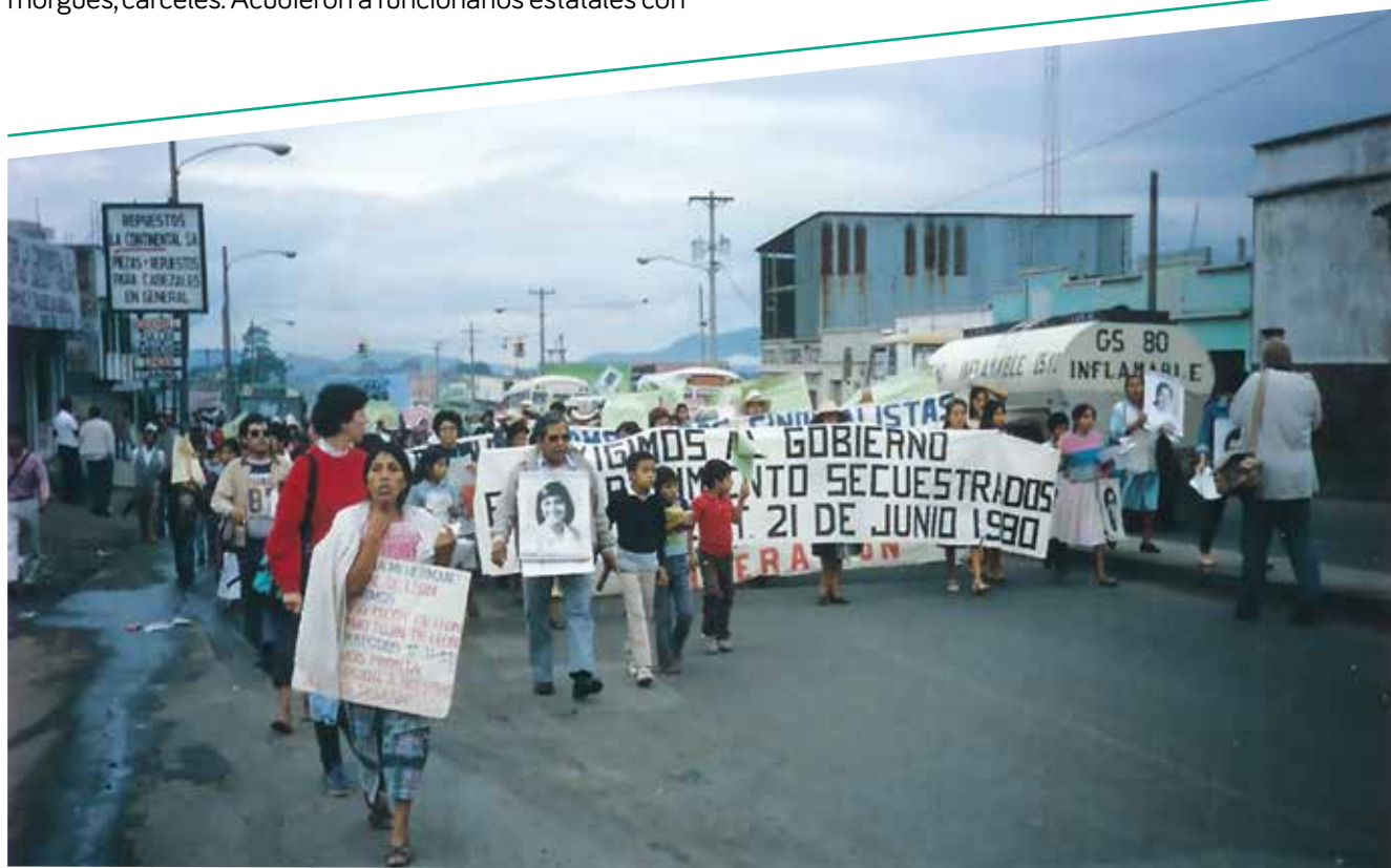
PBI acompaña una marcha del GAM en 1989.

el fin de averiguar su paradero, a pesar del riesgo que en aquel momento de dictadura militar y terror generalizado, suponían esos contactos. Sin embargo, solo encontraron rechazo, burla y mentiras. Las personas desaparecidas eran estudiantes, docentes, sindicalistas, religiosas, entre otras, que lucharon contra las continuas dictaduras y en pro de mejoras sociales para el pueblo guatemalteco. El GAM fue su manera de organizar acciones conjuntas de búsqueda, compartir sus dolorosas historias, consolarse y apoyarse mutuamente. Así fue como la familia de