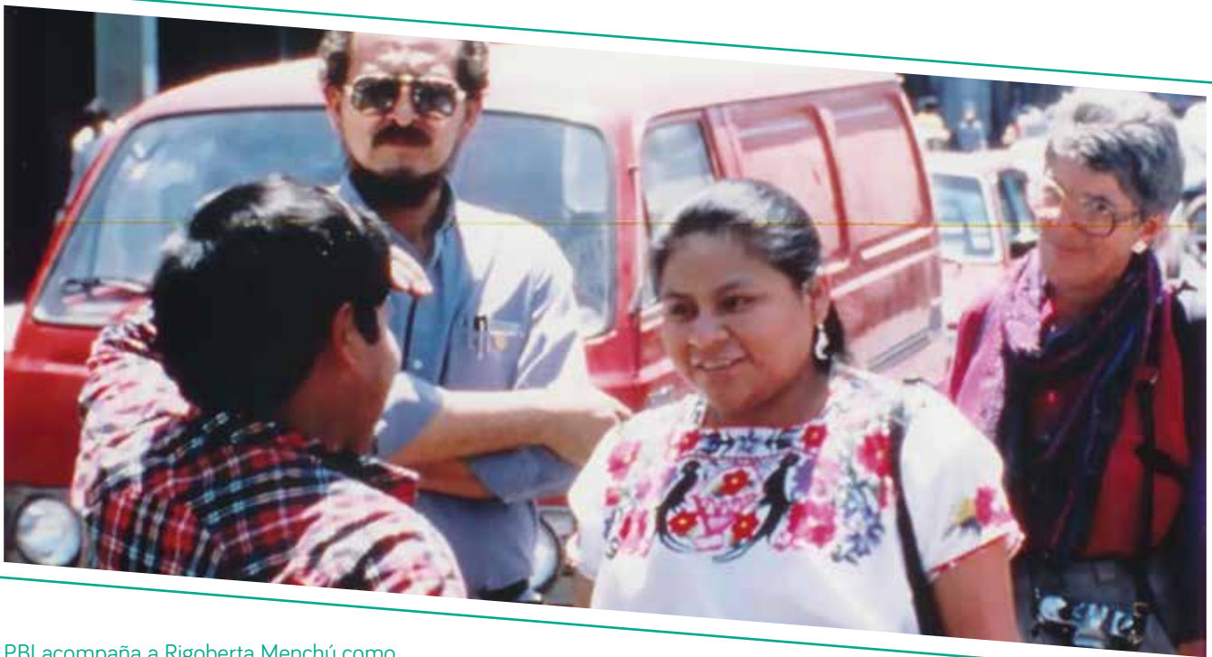
PBI acompaña a Rigoberta Menchú como integrante de la Representación Unitaria de la Oposición Guatemalteca (RUOG) en su visita a Guatemala, 1989

en un canal de información hacia el exterior, alertando a la comunidad internacional sobre amenazas y otras violaciones que se estaban dando contra la población civil, especialmente la organizada.