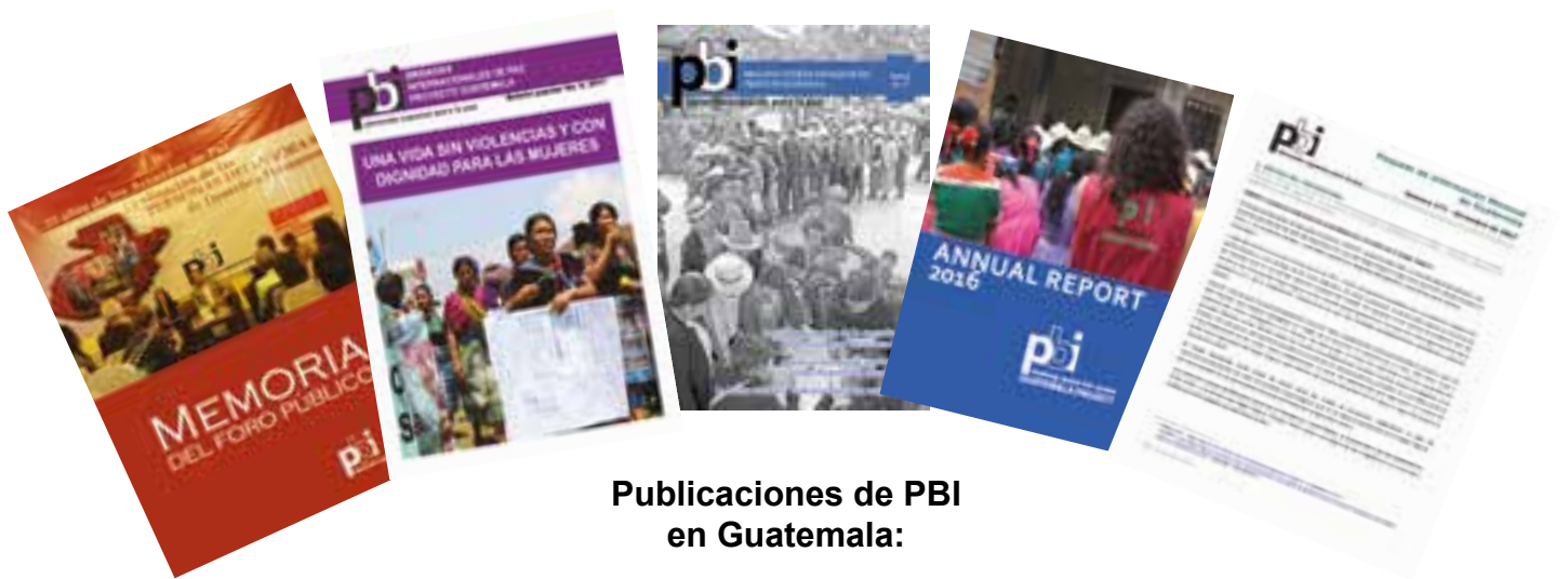
Publicaciones de PBI en Guatemala:

La difusión de las publicaciones de PBI permite devolver la información a las comunidades y hacerla llegar fuera de Guatemala; además, ayuda a que la comunidad internacional se entere de la situación de las personas defensoras en Guatemala.