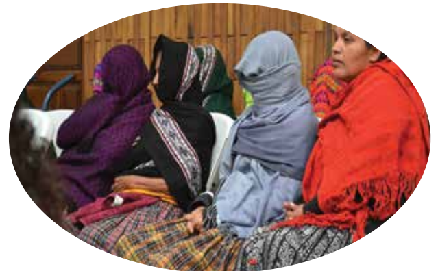
Nake'xjultika naq tz'aqalaq li rahob'tesiik