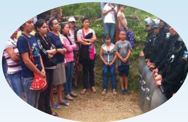
Nake'xkol rix li k'ulub' chi rix li ch'och' ut li loq'laj na'ajej

Nake'xyal xq'e re xyu'aminkil li tiikilal ut li juntaq'eetalil