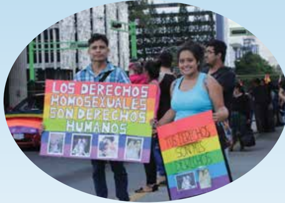
Nake'xkol xk'ulub'eb' li jalanqjalanq paay chi poyanam