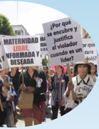
elak re naq ink'a' b'tesiik li ixq