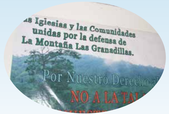
Nake'xkol rix chi xjunil li wank chi ru li loq'laj ch'och'