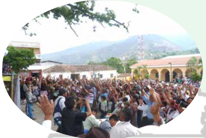
Sakapulas, xteepal K'iche'