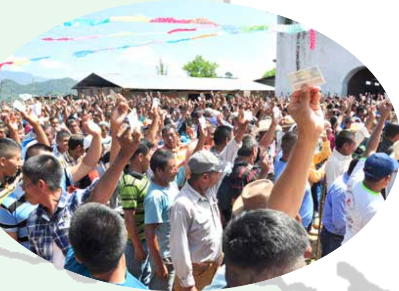
Chi K'ajb'om, Xteepal Alta Verapaz

Naxq'ax jun millón li ke'tz'aqon sa' o'laju xlaje'k'aal (95) chi tenamit ut eb' li poyanam ke'xye INK'A' naqaj li xningaleb' ru k'anjel, INK'A' naqaj naq toj te'chalq chik xkomon, tz'aqalaq.