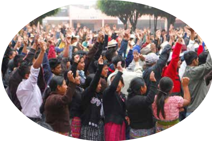
Uspantan, xteepal K'iche'